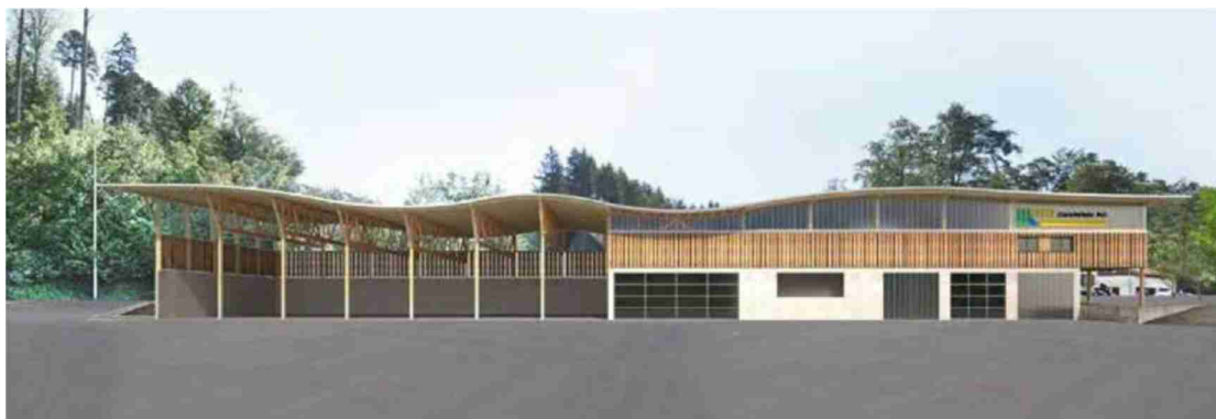
Neues Betriebszentrum der ZHH in Illnau – Realisierung im 2022

Nach 14 Jahren war es wieder soweit: Die ZürichHolz AG erhöhte an der ausserordentlichen Generalversammlung vom 3. Februar 2022 das Aktienkapital um rund CHF 3 Mio. und offeriert qualifizierten Anlegern aus der Schweizer Wald-, Holz- und CO 2 -Wirtschaft eine renditestarke, nachhaltige Anlagemöglichkeit. Auch neue Geschäftsfelder wie die Pflanzenkohle bieten interessante Wachstumsperspektiven.