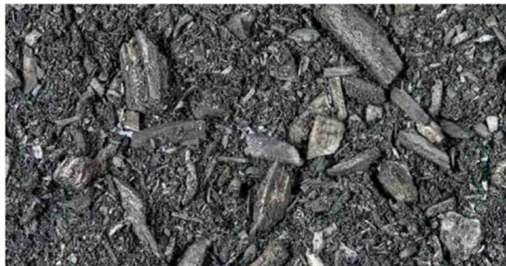
Pflanzenkohle, wie sie die ZHH Ende 2022 herstellen und vertreiben wird

ZürichHolz AG ist einer der führenden Holzvermarkter der Schweizer Wald- und Holzindustrie. Die Gesellschaft versorgt nationale Holzverarbeiter mit Rund- und Industrieholz, regionale Holzkraftwerke und Wärmeverbände mit Energieholz sowie ab 2022 Futtermittelhersteller, Landwirtschaftsbetriebe etc. mit mikrobiell aktivierter Pflanzenkohle als Nährstoff-, Wasser- und CO 2 -Speicher. ZürichHolz hält zudem diverse Beteiligungen, darunter das grösste Schweizer Holzheizkraftwerk in Zürich-Aubru gg, ZürichHolzlogistik AG, Fagus Suisse SA und LignoCarbon Schweiz AG. ZürichHolz ist eines der wenigen Schweizer Wald- und Holzunternehmen, das privaten und institutionellen Anlegern offensteht (Valor CH0021258907).